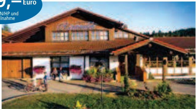
Hotelresort Reutmühle**** in Waldkirchen / Bayerischer Wald inkl. 3 ÜN/DZ/HP/Kursteilnahme ab 69,00 Euro