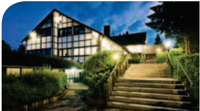
Sporthotel & Resort Grafenwald**** in Daun /Vulkaneifel inkl. 3 ÜN/DZ/HP/Kursteilnahme ab 109,00 Euro