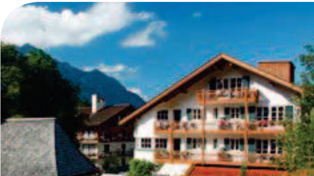
Hotel Haus Hammersbach**** in Grainau am Fuße der Zugspitze inkl. 3 ÜN/DZ/HP/Kursteilnahme ab 109,00 Euro