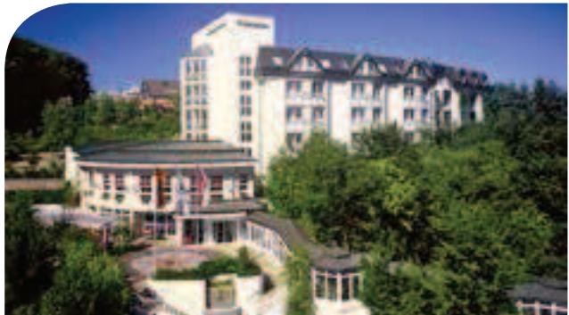
relexa hotel Bad Salzedt furth**** im Leinebergland inkl. 3 ÜN/DZ/HP/Kursteilnahme ab 89,00 Euro