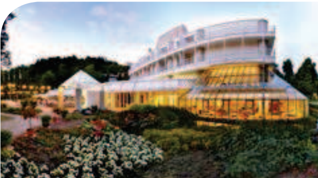
Best Western Premier Parkhotel**** in Bad Mergentheim inkl. 3 ÜN/DZ/HP/Kursteilnahme ab 109,00 Euro