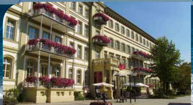
Hotel Kaiserhof Victoria**** in Bad Kissingen / Bayerische Rhön inkl. 3 ÜN/DZ/HP/Kursteilnahme ab 109 Euro