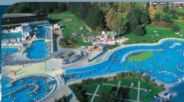
Vital-Hotel Jagdhof im Kurort Bad Füssing nahe Passau inkl. 6 ÜN/DZ/VP/Kursteilnahme ab 259 Euro