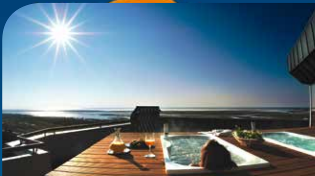
ambassador hotel & spa**** in St. Peter Ording / Nordseeküste inkl. 3 ÜN/DZ/HP/Kursteilnahme ab 179 Euro