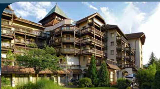
Best Western Hotel Bad Herrenalb*** Superior in Bad Herrenalb / Schwarzwald inkl. 3 ÜN/DZ/HP/Kursteilnahme ab 99 Euro