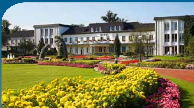
Best Western Premier Parkhotel**** Superior in Bad Lippspringe / Teutoburgerwald inkl. 3 ÜN/DZ/HP/Kursteilnahme ab 119 Euro; inkl. 5 ÜN/DZ/HP/Kursteilnahme ab 279 Euro