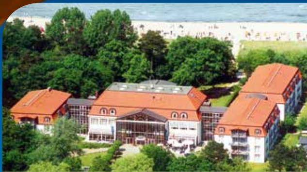
Seehotel Großherzog v. Mecklenburg**** im Ostseebad Boltenhagen inkl. 3 ÜN/DZ/HP/Kursteilnahme ab 129 Euro