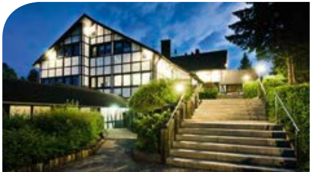
Sporthotel & Resort Grafenwald**** in Daun /Vulkaneifel inkl. 3 ÜN/DZ/HP/Kursteilnahme ab 109,00 Euro