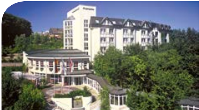
relaxa hotel Bad Salzetfurth**** im Leinebergland inkl. 3 ÜN/DZ/HP/Kursteilnahme ab 89,00 Euro