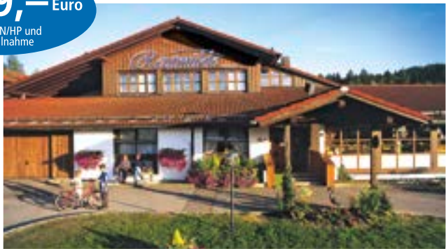
Hotelresort Reutmühle**** in Waldkirchen / Bayerischer Wald inkl. 3 ÜN/DZ/HP/Kursteilnahme ab 69,00 Euro