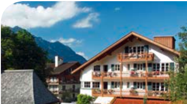
Hotel Haus Hammersbach**** in Grainau am Fuße der Zugspitze inkl. 3 ÜN/DZ/HP/Kursteilnahme ab 109,00 Euro