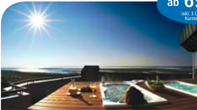
ambassador hotel & spa**** in St. Peter Ording / Nordseeküste inkl. 3 ÜN/DZ/HP/Kursteilnahme ab 179,00 Euro

ab 69,– Euro inkl. 3 ÜN/HP und Kursteilnahme