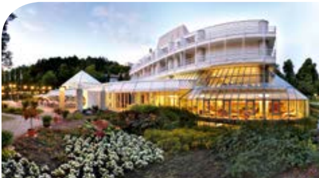
Best Western Premier Parkhotel**** in Bad Mergentheim inkl. 3 ÜN/DZ/HP/Kursteilnahme ab 109,00 Euro